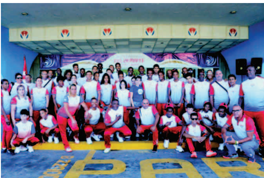
Delegación cubana a los VI Juegos Deportivos Centroamericanos y del Caribe Escolares

Los primeros Juegos Deportivos Centroamericanos y del Caribe Escolares se organizaron en San Juan 2007, las siguientes ediciones tuvieron lugar cada dos años, en Puebla, Panamá, Armenia y Yucatán. Por tanto, Venezuela pudo rescatar la cita tras una prolongada interrupción, para bien de las nuevas generaciones de atletas.