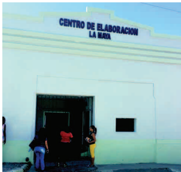
El Centro de Elaboración, convertido en Unidad Empresarial de Base, ha sido modernizado y sus producciones se comercializan en el territorio

“Asimismo, en los picos de cosecha, cada una de las panaderías se convierten en mini-industrias procesadoras de guayaba, mango..., con el fin de elaborar pulpas. Además, cada forma productiva tiene la responsabilidad de abastecer en la ciudad santiaguera dos agro-mercados, dos veces a la semana y no desechamos la aspiración de entregar a la población 60 libras per cápita de granos, viandas, hortalizas y vegetales.