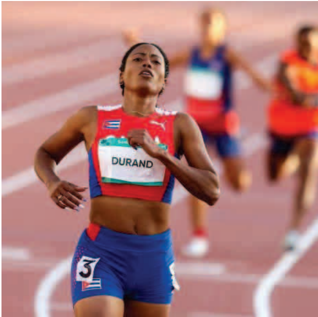
Omara Durand buscaba el triplete en Santiago 2023

La primera presentación en el Centro Atlético Mario Recordón reafirmó que si alguien quiere desbancarla en la categoría T12 (débiles visuales profundos) tiene que hacer un esfuerzo enorme, pues el crono de 23.59 segundos (s) garantizó su presencia en la final de los 200 metros (m) y fijó un récord para esas citas.