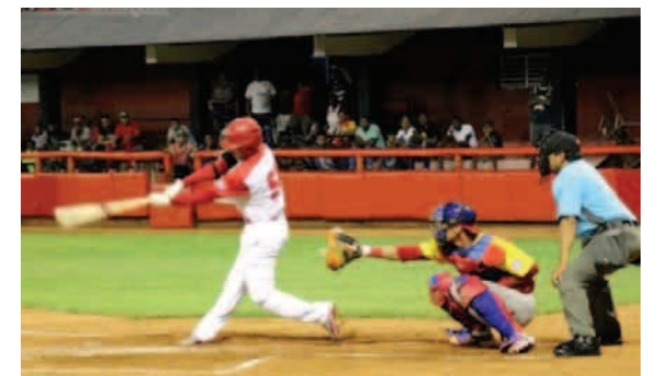
Las Avispas necesitan aumentar su ofensiva