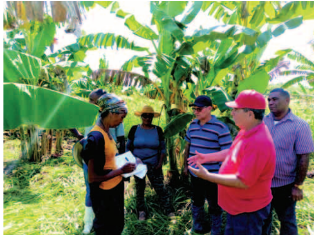
El Primer Secretario del Partido en la provincia, chequeó los avances en los polos productivos y áreas de desarrollo agrícola de Songo-La Maya

En Songo-La Maya hay un hospital general, con servicio de hemodiálisis, cuatro policlínicos y más de 100 consultorios del médico y la enfermera de la familia, 16 totalmente reparados.