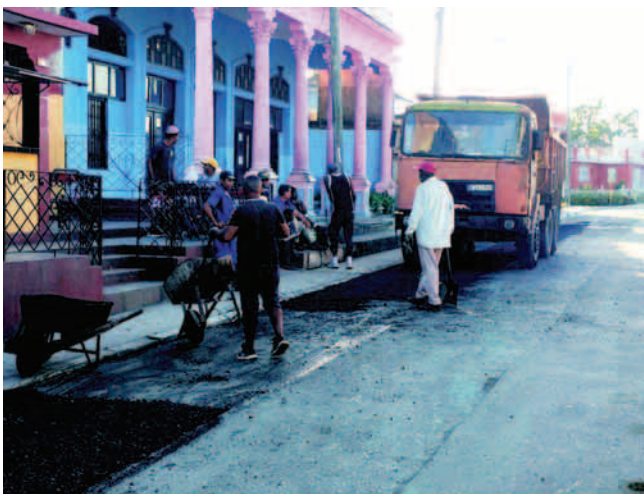
En el poblado de Alto Songo, brigadas de mantenimiento vial rehabilitan la calle principal

Durante décadas el abasto de agua a la ciudad de La Maya fue el mayor de los problemas, puesto que los déficits de la presa Joturo aumentan a la par del cambio climático. Hoy el panorama se transforma por la revitalización del embalse conocido como La Sultana y su consiguiente sistema, que beneficia a cerca de la mitad de los más de 25 000 ciudadanos. “Una obra que se realizó en medio de las escaseces económicas por las que atravesamos, y con esta logramos bajar los ciclos de agua de 90 días a 21”, reconoció la Presidenta.