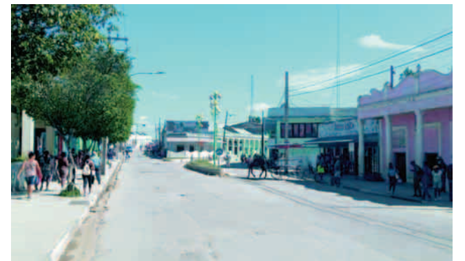
La higiene comunal en la ciudad de La Maya, distingue el entorno

La limpieza comunal se mantiene en todo el territorio. Mientras que los Servicios Necrológicos han estado afectados, principalmente el parque automotor, debido al déficit de piezas de repuesto, por lo que se han buscado alternativas como es la de alquilar autos particulares que reúnan las condiciones para brindar ese servicio, aunque no siempre se ha contado con la disponibilidad de estos y han ocurrido demoras, por lo que se trabaja para que las afectaciones sean mínimas.