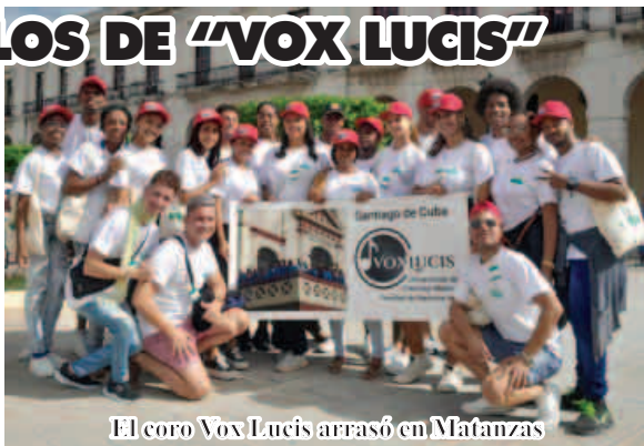
El coro Vox Lucis arrasó en Matanzas

"Santus; Negro Bombón, Gracias a la vida; Juramento, que 'hicimos' en el teatro Sauto; Andes lo que andes, de Amaury Pérez; El Castigador, El breve espacio en que no estás, de Pablito Milanés... la mayor parte de nuestro repertorio es del maestro