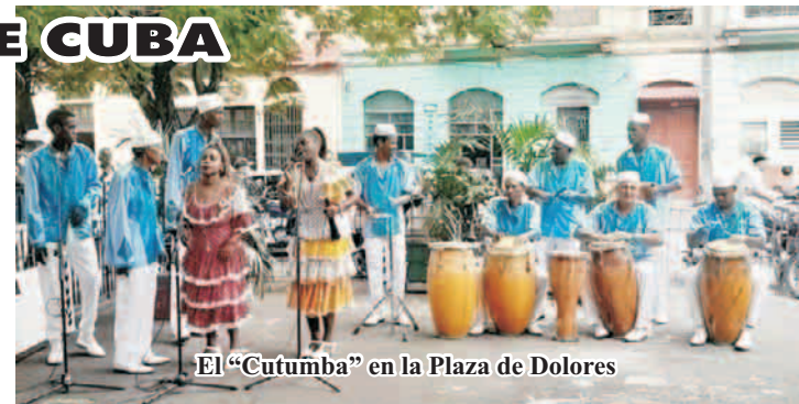
El "Cutumba" en la Plaza de Dolores

la Cía Folclórica Kokoyé, Kazumbi... "Timbalaye" en 2024 rinde homenaje a los cabildos de nación y las casas templo; busca preservar la rumba que es Patrimonio de la Humanidad; fortalece la toma de conciencia contra el colonialismo cultural; enaltece los valores del legado africano, y reconoce los 30 años de la declaración por la UNESCO, de la Ruta de las personas esclavizadas.