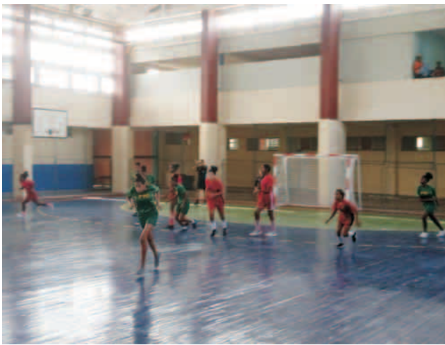
La Eide santiaguera fue reconocida por sus resultados en el programa 65x60=Fidel

“Hay una buena cantera deportiva en nuestra provincia, sobre todo en los deportes de combate y otros, como del atletismo. Todos los años las promociones van en ascenso y consideramos que el curso 2024-2025 una buena cantidad de atletas que participaron en los Juegos Escolares sean llamados a integrar las selecciones nacionales”, evaluó que la tarea en las escuadras juveniles se facilitaría si se mantuvieran las Escuelas Superiores de Perfeccionamiento Atlético, de ahí que la dirección del país realice esfuerzos por retomarlas.