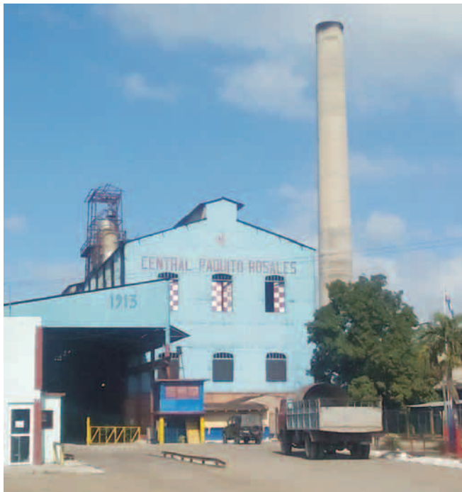
El antiguo central Borjita cumplió 110 años en 2023

En septiembre de 2022, fueron creadas en estas entidades empresas agroindustriales azucareras (EAA), estrechamente relacionadas con la implementación de las 93 medidas aprobadas por el Gobierno de la República para salvar la agroindustria azucarera.