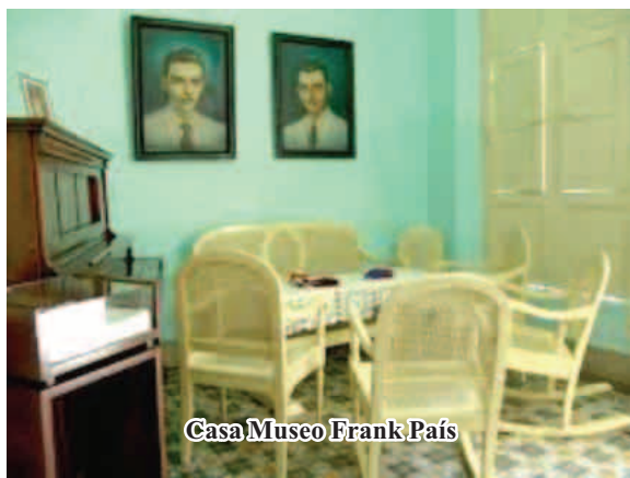
Casa Museo Frank País