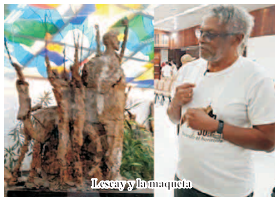
Lescaj y la maqueta

¿Qué pasó?'. Mire, Comandante, el problema está en que ya se ha declarado la fecha del Congreso y es tal el nivel de presión, que en el proceso constructivo se están cometiendo errores por cumplir con la fecha. Comandante, mi opinión es que si por ejemplo, el Hotel