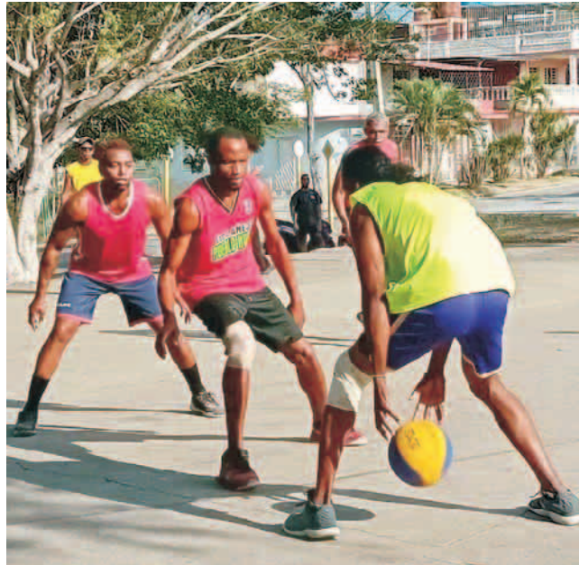
El baloncesto 3x3 sobresalió en la Toma deportiva Siempre Joven

Espinal Ribeaux apuntó que Santiago de Cuba fue escenario de otras acciones impulsadas por el proyecto, destacándose la simultánea de ajedrez que tuvo lugar “en los nueve municipios, con resultados satisfactorios”.