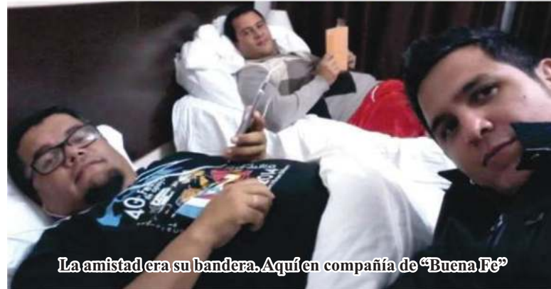
La amistad era su bandera. Aquí en compañía de “Buena Fe”