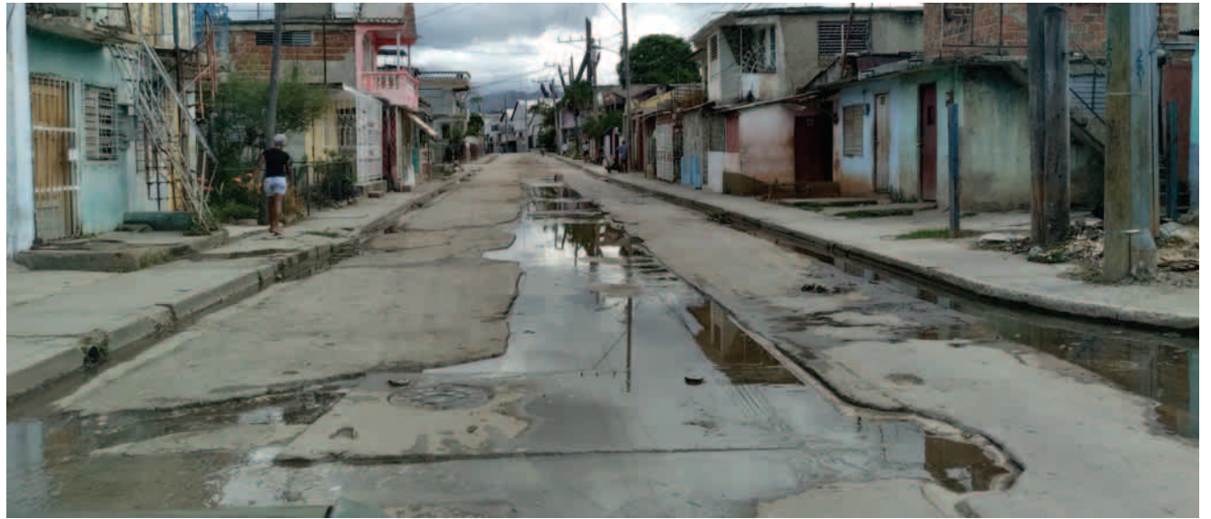
En la calle Camino de la Ceiba, al sur de la Plaza de la Revolución, los salideros han devenido en corrientes de agua

Inés María Chapman Waugh, Viceprimera Ministra de la República, en reciente visita de trabajo al territorio, indicó recuperar el esquema operacional concebido para el acueducto de la ciudad, ponderando los ciclos según lo planificado y "concediéndole valor de uso a lo construido, siempre en