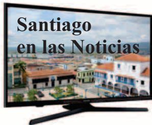
Angela Santiesteban Blanco angela.santiesteban @nauta.cu