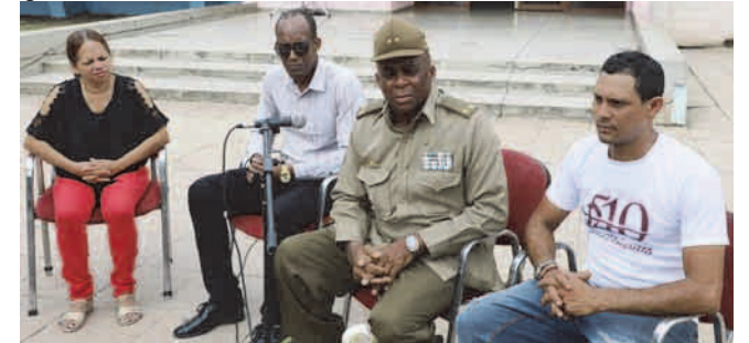
En el poblado de El Cobre, en cada aniversario se recuerda al héroe

Flor Crombet no es solo un nombre en los libros de Historia, es un faro que sigue guiando a Cuba, especialmente a Santiago, la ciudad que lo vio crecer y a la que defendió con honor.