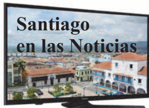
Angela Santiesteban Blanco angela.santiesteban @nauta.cu