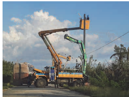
Se trabaja en el restablecimiento eléctrico en la carretera de Guamá