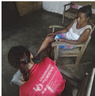
Jóvenes universitarios visitan e intercambian con la población de la zona rural que fue afectada por 'Melissa'