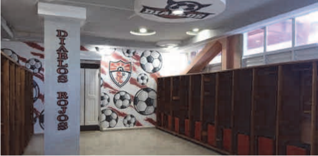
Fotos: Camerinos del estadio Antonio Maceo

“El reto es seguir siendo una instalación insignia con respecto a los eventos internacionales, acogedora para las selecciones que compiten, así como los equipos de Santiago de Cuba, los atletas de desarrollo de la Escuela de Iniciación Deportiva Escolar Capitán Orestes Acosta y otros centros del municipio que acogemos”, concluyó.