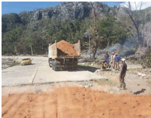
Vial de la comunidad Sigua y el parque de La Fantasía