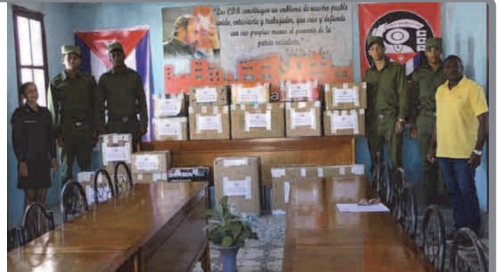
El Ministerio del Interior realizó una entrega de donaciones a los CDR en Santiago de Cuba, destinadas a apoyar a las familias damnificadas en diferentes comunidades