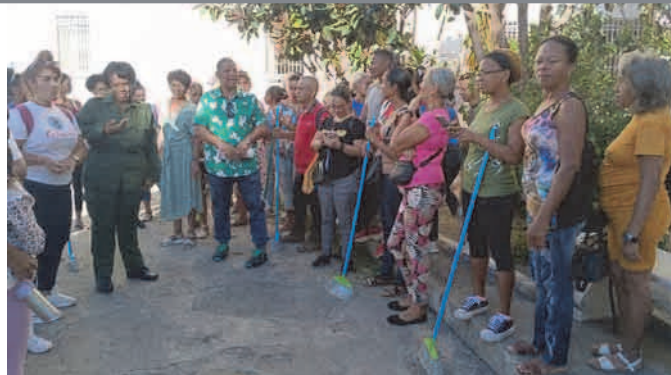
En el Día de la Medicina Latinoamericana representantes de las organizaciones de masas y trabajadores de varios organismos apoyaron en la limpieza, embellecimiento e higienización de los hospitales del territorio