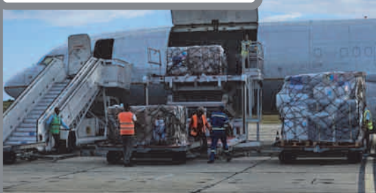
Departamento de Protección Civil y Ayuda Humanitaria de la Unión Europea, el Programa Mundial de Alimentos y otras agencias especializadas de la Organización de las Naciones Unidas, llegan con una carga en apoyo a los damnificados del oriente del país tras el paso del huracán Melissa