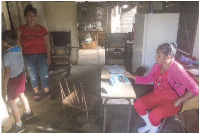
Era mi deber garantizar que mis alumnos volvieran a sus clases, por eso llevé el aula a mi casa

De seguro rememoró la llegada a su actual escuelita, tras mudarse a la zona. Y es que toda su experiencia y pasión, el ímpetu de los años dedicados a la noble tarea de educar, acom-