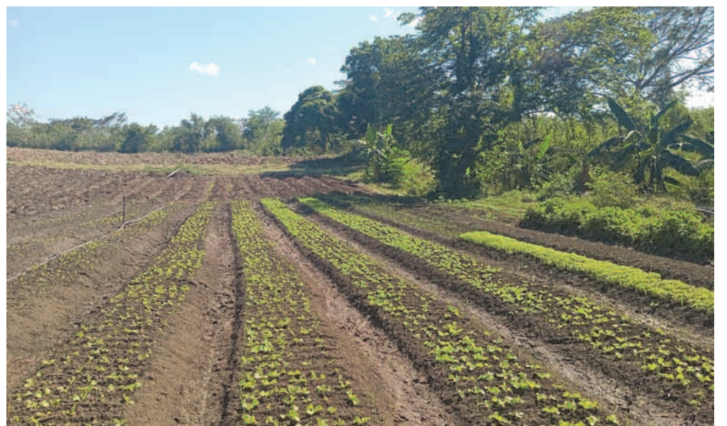
En el polo productivo La Confianza, de Mella, se avanza en la preparación de tierra, la siembra y producción de alimentos, con énfasis en las hortalizas