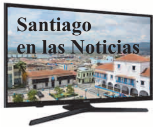
Angela Santiesteban Blanco angela.santiesteban @nauta.cu