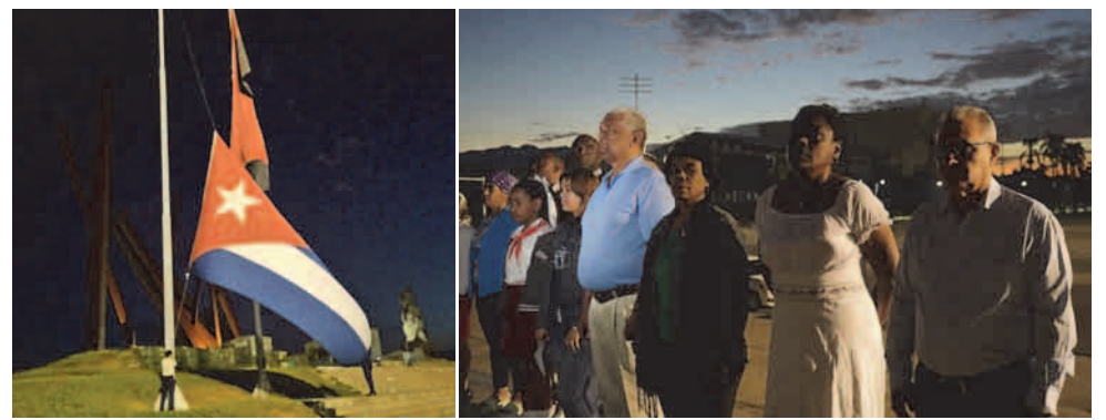
Las máximas autoridades de Santiago de Cuba estuvieron presente en el Homenaje a la Bandera que se realizó el 31 de diciembre, en la Plaza de la Revolución