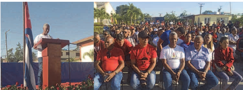
La conmemoración de la liberación de Maffo y El Escandel, también marcó las últimas jornadas del mes de diciembre

Por eso, y por el espíritu alegre y humanista que nos caracteriza, en los días finales de diciembre e inicio del año, nos sobraron razones para celebrar. Las imágenes son una prueba de esto