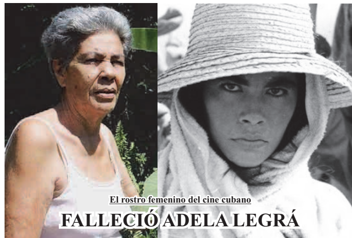
El rostro femenino del cine cubano

Así despidió Cultura a 2025; así recibe a 2026: con unos deseos enormes de cumplir, sin perder de vista, jamás, que el bienestar espiritual de este pueblo depende, en buena medida, de quienes hacen funcionar el sector.