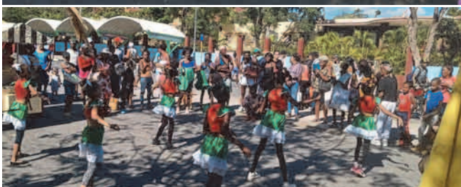
Actividades recreativas para los niños y demás miembros de la familia para despedir el 2025