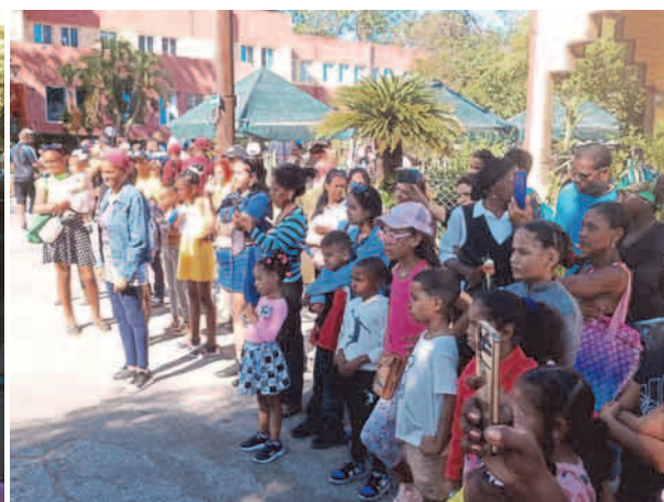
La calle Moncada recibió a los niños con ofertas variadas