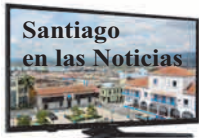
Angela Santiesteban Blanco angela.santiesteban @nauta.cu