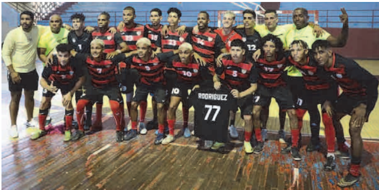
Los Diablos consiguieron un subtitulo en la Liga Nacional de Fútbol

El año 2025 bajó el telón y en el plano deportivo, Santiago de Cuba retuvo el segundo lugar nacional en la emulación, que tiene en cuenta el rendimiento de los atletas en las categorías pióneril, escolar, juvenil y de mayores.