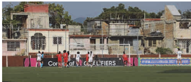
En la última jornada, los goles de Cuba llegaron por la vía del penal