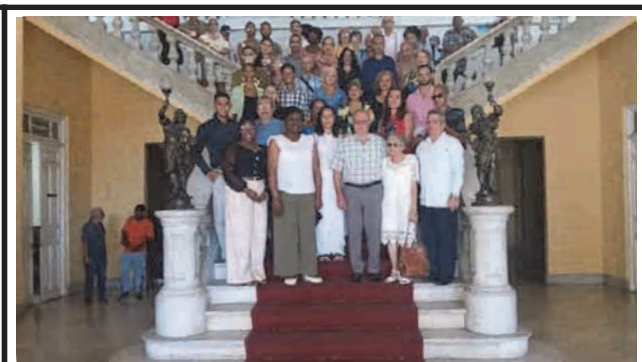
El Salón de los Espejos acogió la celebración por el Día de la Prensa Cubana, donde fue reconocida la labor de los profesionales del sector.