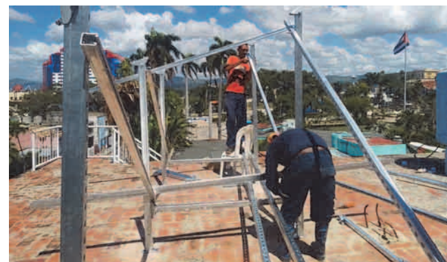
Las oficinas comerciales de la Empresa Eléctrica Santiago de Cuba también se benefician con el montaje de los módulos de paneles fotovoltaicos. En imágenes la instalación del kit fotovoltaico en la Oficina Comercial de Vista Alegre.

posibilidad de adquirir módulos que incluyen paneles solares fotovoltaicos, de 800 y 12000 watts.