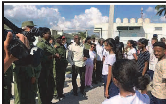
En la zona de Defensa 30 de Noviembre, jornada dedicada al Día de la Defensa, con la participación de las máximas autoridades.

En los momentos que enfrentamos ha sido imposible cumplir con la rotación de los bloques por el estado de la CTE Antonio Guiteras y el apagón de la zona Occidental, que trajo consigo que el déficit aumentara. Estamos tratando de darles, al menos, dos horas de servicio a los circuitos, apuntó. (Pase a página 3)