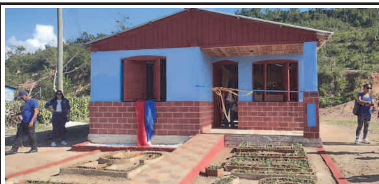
En Segundo Frente se concluye la primera vivienda edificada con ladrillos, cal, arena y polvo de piedra. Demostrando que es posible este tipo de construcción.