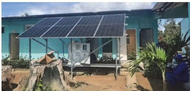
Trabajadores de la Empresa de Grupos Electrónicos de Montaña realizaron el montaje en el Hogar Materno Lidia Doce de San Luis.

Con el montaje de sistemas fotovoltaicos en instituciones de la Salud, funerarias, sucursales bancarias, oficinas comerciales y de comunicaciones, así