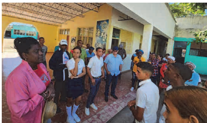
Desde el consejo popular Matahambre en Songo-La Maya, con una demografía de 2 280 pobladores, se constata el alcance de las políticas de beneficio social y económico en zonas del Plan Turquino