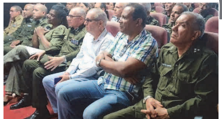
Este 26 de marzo se conmemoró el 67 aniversario de la creación de los Órganos de la Seguridad del Estado, del Ministerio del Interior, y en Santiago de Cuba se recordó la fecha y se reconoció la labor de estos combatientes