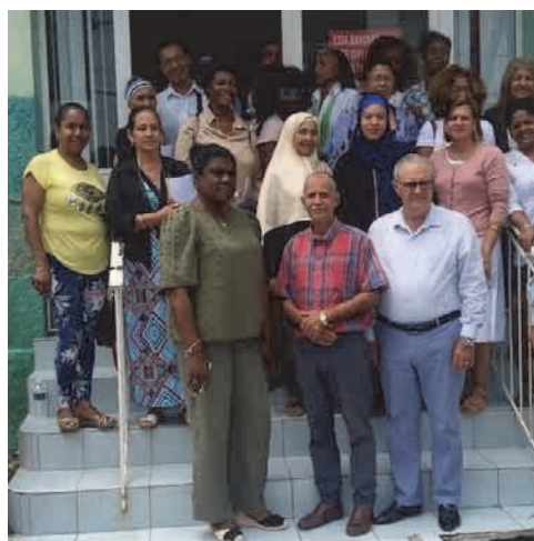
Se reúnen autoridades con mujeres de instituciones religiosas y asociaciones fraternales. Se les explicó sobre el programa de adelanto a la mujer y los servicios del BPA