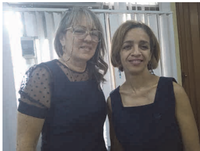
Presidenta del comité de género y miembro del ejecutivo, de izquierda a derecha

Por otra parte, destacó que desde el funcionamiento del