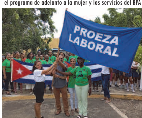
Este viernes la Dirección General de Educación recibe de manos del Sindicato Provincial la bandera de Proeza Laboral, por el destacado trabajo tras el paso del huracán Melissa y la recuperación