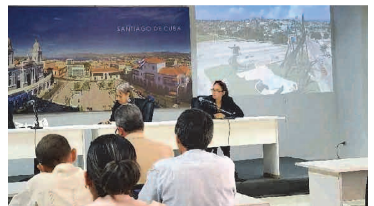
Presentación del Proyecto de Ciencia, Tecnología e Innovación Sistema Integrado de Comunicación Social de Santiago de Cuba (SICOM), aprobado por el Programa Sectorial La Comunicación Social como pilar de la gestión de gobierno en Cuba, dirigido por el Instituto de Información y Comunicación Social (ICS), gestionado por su Escuela Ramal. Fue uno de los nueve proyectos aprobados en la convocatoria Nacional y el primero en presentarse en el país