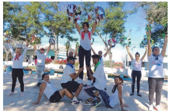
En todos los municipios se llevaron a cabo actividades por el 6 de abril

No solo invitó a los Estados y al sistema de las Naciones Unidas, sino a las organizaciones internacionales competentes, las organizaciones deportivas internacionales, regionales y nacionales, la sociedad civil, incluidas las organizaciones no gubernamentales y el sector privado, y todos los demás interesados pertinentes a cooperar, observar y crear conciencia al respecto.