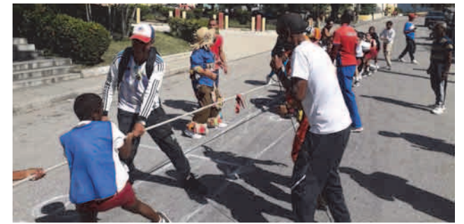
La actividad Pintando por la Paz se celebró el pasado 4 de abril

De igual manera, se han potenciado una serie de actividades para mantener el vínculo con las comunidades santiagueras, sobresaliendo aquellas que festejaron el aniversario 65 de la Organización de Pioneros José Martí y el 64 de la Unión de jóvenes Comunistas.