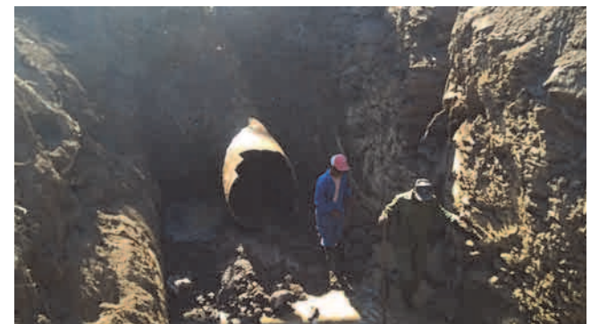
Tras largas jornadas de trabajo continuo se solucionó la avería de la conductora

En el sistema Parada se recupera el servicio y San Juan depende asimismo de la electricidad, con alargamiento de los ciclos, principalmente en Santa Bárbara y el litoral.