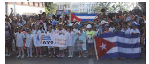
Niños y adolescentes santiagueros agasajaron a los trabajadores en desfile por el Primero de Mayo

Bajo el lema "La Patria se defiende" representantes de la Organización de Pioneros José Martí junto a sus maestros y familias, alumnos de la Enseñanza Media y universitarios santiagueros, unidos en hermoso haz de generaciones, mostraron una vez más su compromiso con la preserva-