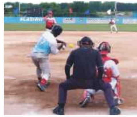
Avileños y santiagueños se enfrentaron en una Final por séptima ocasión en los últimos 10 torneos

Asimismo, ya fue anunciado por la Comisión Nacional del llamado "deporte de la bola blanda" que en octubre venidero se desarrollará el torneo de la segunda división, en Pinar del Río, donde además de los locales, los elencos de Las Tunas, Guantánamo y La Habana buscarán el único boleto al Nacional del 2023, el cual se piensa realizar en el mes de marzo.