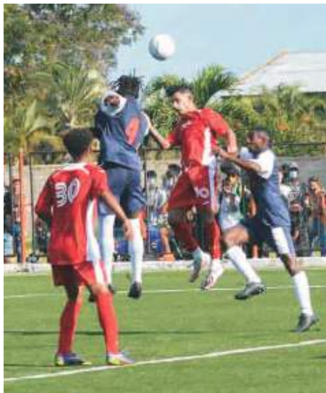
El duelo entre santiagueros y camagüeyanos promete ser muy disputado

En la segunda fecha, los agramontinos vencieron al subcampeón del Apertura, Artemisa, con pizarra de 2-0, y