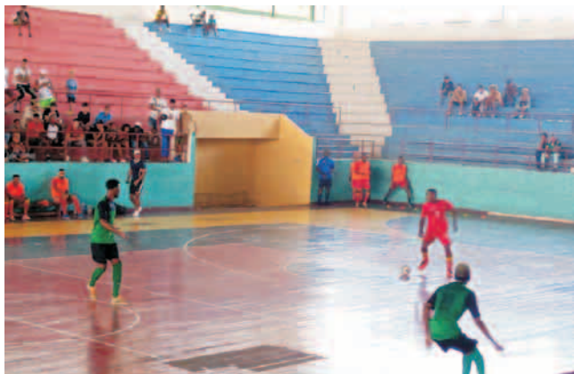
Los Diablillos debían haber enfrentado al conjunto de Cienfuegos en el Ateneo Deportivo Armando Mestre

Los Diablillos santiagueros intercambiaron golpes con el equipo de Ciego de Ávila (4-1 y 4-5) y cerraron su participación en la segunda fase de la Liga Nacional de Futsal, sumando 29 unidades en el Grupo Oriental.