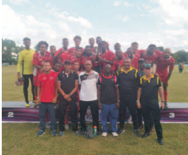
Santiago empieza la temporada con el pie derecho

Comenzó su nuevo ciclo con el pie derecho, este éxito ilusiona de cara a la 108 Liga Nacional. Sin embargo, la lid ha sido aplazada por dificultades con la transportación a partir del déficit de combustible en el país, lo mismo ocurre con el Campeonato femenino, según informó Ariel Speck Comisionado Provincial de Fútbol.