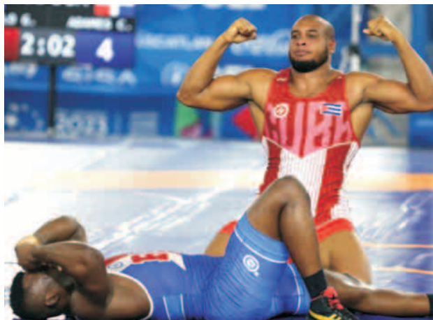
El Campeonato Mundial de Luchas se desarrolló del 16 al 24 de septiembre